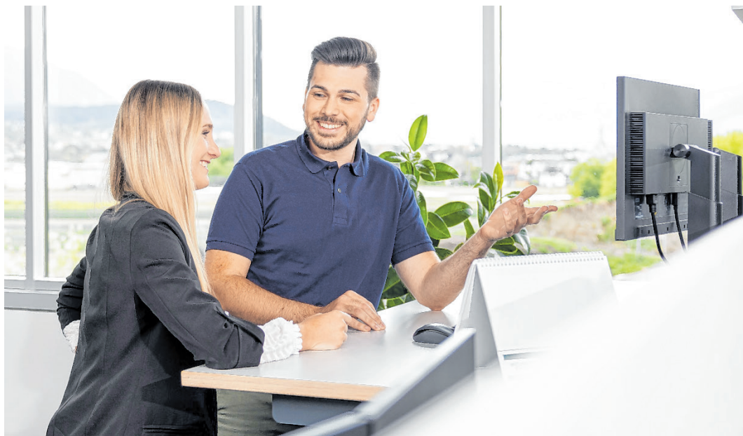
Die Mitarbeiter:innen der Felder Group profitieren von hochwertigen Arbeitsplätzen und zahlreichen Benefits.