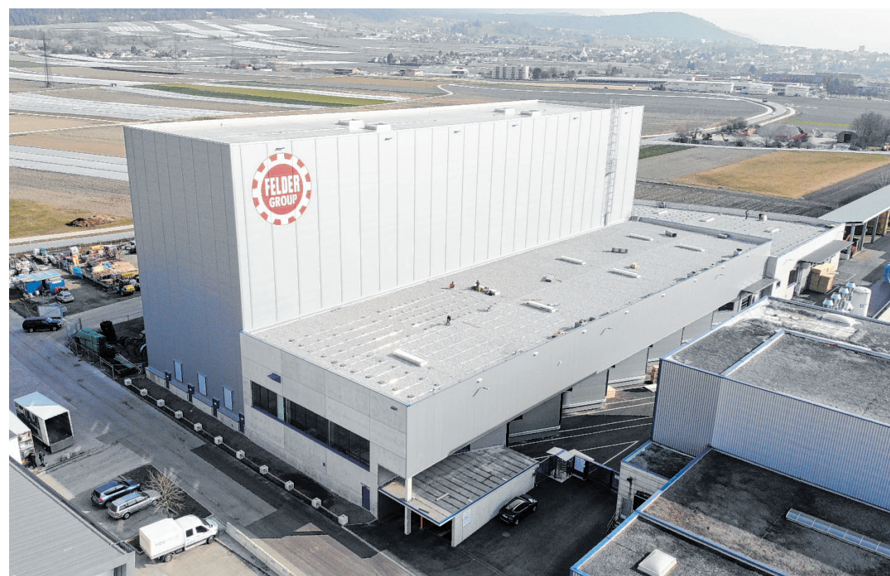
Das neue automatische Hochregallager in Hall in Tirol fasst beeindruckende 11.700 Stellplätze für Europaletten.