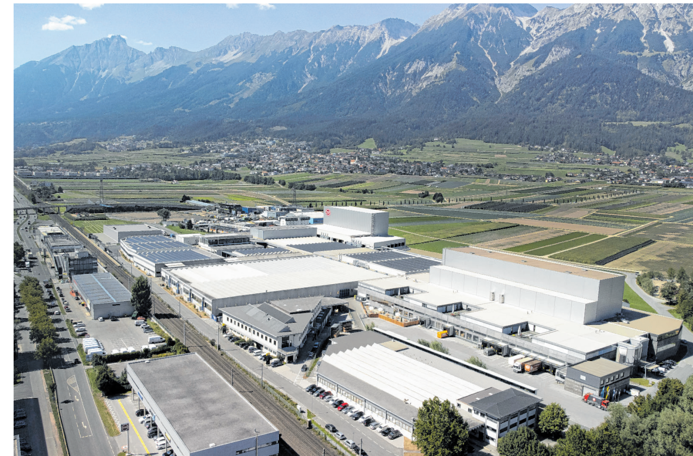
Am Produktionsstandort Hall in Tirol wird der Großteil aller Maschinen montiert.

Nachhaltigkeit, Umweltbewusstsein und Ressourcen