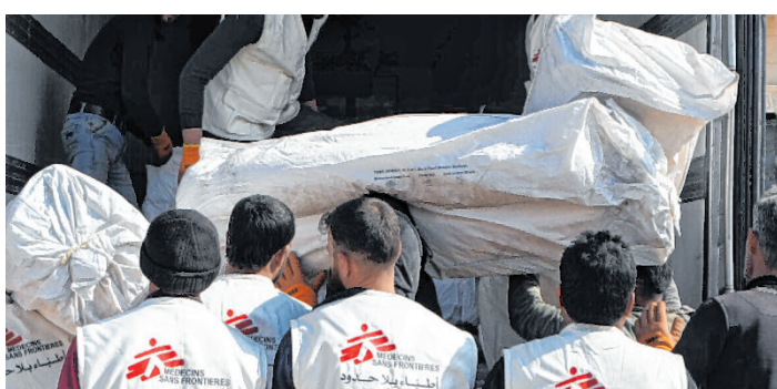
Die Felder Group unterstützt die Hilfstätigkeit von Ärzten ohne Grenzen in den betroffenen Gebieten.